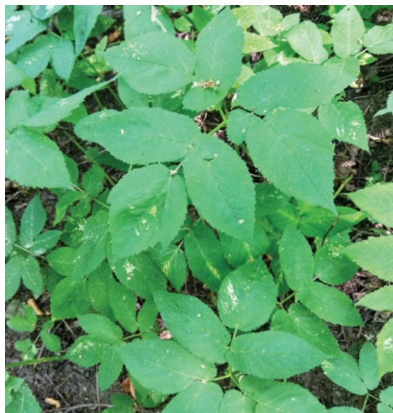
Dve domorodni vrsti s pritličnimi listi, ki so podobni deljenolistni rudbekiji, obe pa tudi rasteta v podobnem okolju: (desno) navadni baldrijan ( Valeriana officinalis ) in (desno) navadna regačica ( Aegopodium podagraria ).