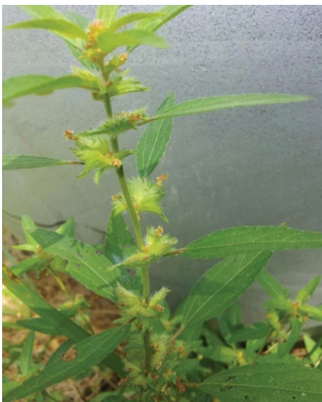
Virginijska akalifa ( Acalypha virginica )