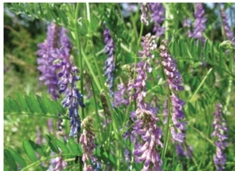
Podobni vrsti metuljnic pri nas: (levo) navadna jastrebina ( Galega officinalis ) in (desno) ptičja grašica ( Vicia cracca )

Mnogolistni volčji bob ima večja socvetja in dlanasto deljene liste.