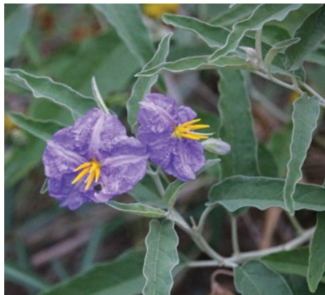
Oljčičevolistni razhudnik ( Solanum eleagnifolium )