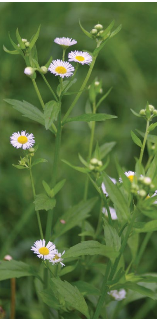
Cvetoča rastlina enoletne suholetnice.