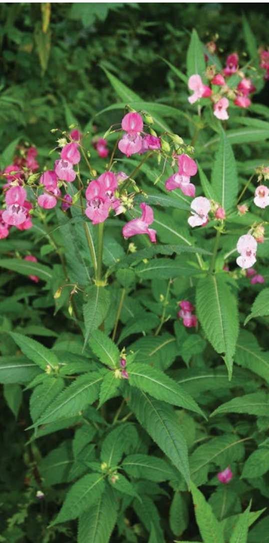
Cvetoče rastline žlezave nedotike.