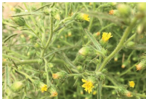
Smrdljiva ditrihovka ( Dittrichia graveolens ), (Foto: Gena Bental)