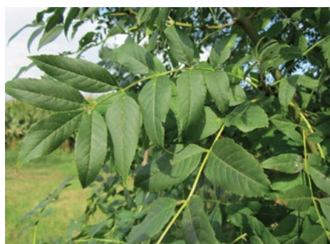
Listi oreha (levo in velikega jesena (desno) so prav tako sestavljeni iz lističev, vendar iz manjšega števila.