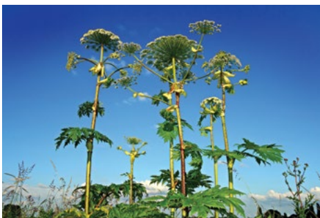
Orjaški dežen ( Heracleum mantegazzianum )