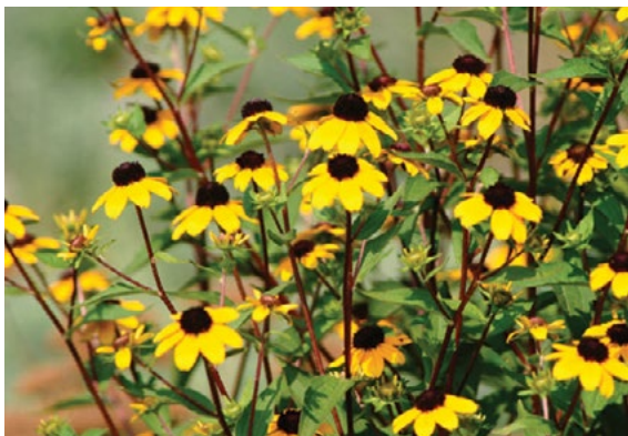
Dve trajni vrsti rudbekij, ki se pri nas gojita kot okras in ki se zaenkrat redkeje pojavljata podivjani: (levo) sijoca rudbekija ( Rudbeckia fulgida ) in (desno) trikpa rudbekija ( Rudbeckia triloba ).