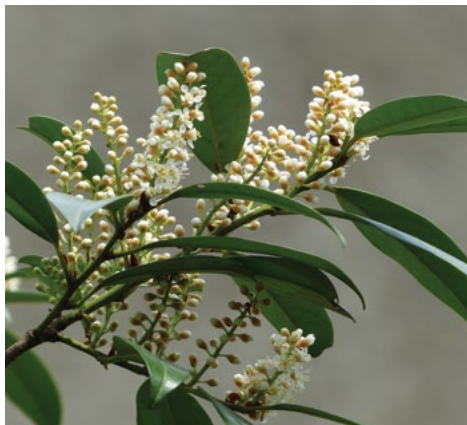
Lovorikovec ( Prunus laurocerasus )