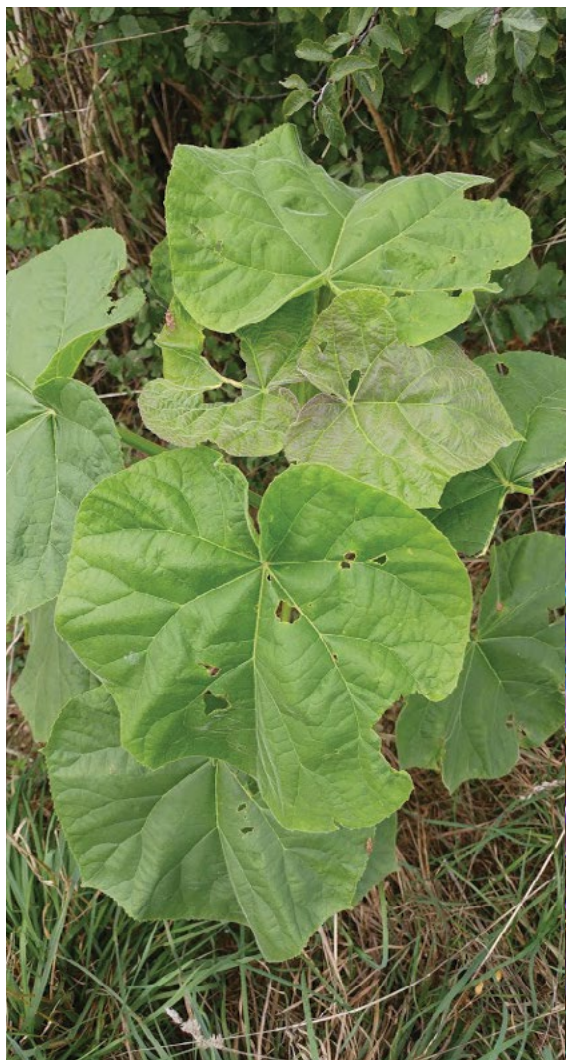
Mlada rastlina navadne pavlovnije, najdena kot podivjana ob kolovozu v dolini Pesnice.

Bolj invazivna je na vzhodu ZDA, kjer se pojavlja na ruderalnih rastiščih, obrečnih krajih in požariščih.