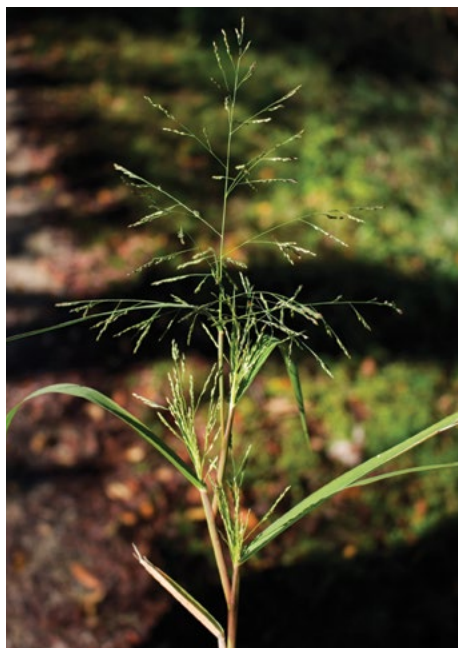
Golo proso ( Panicum dichotomiflorum )