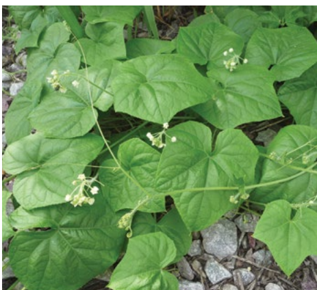
Robati kurbusnjak ( Sicyos angulatus )