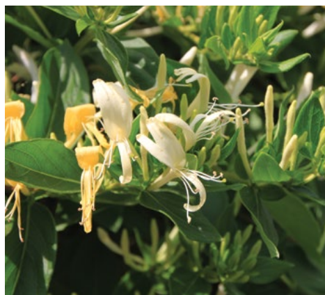
Japonsko kosteničevje ( Lonicera japonica )