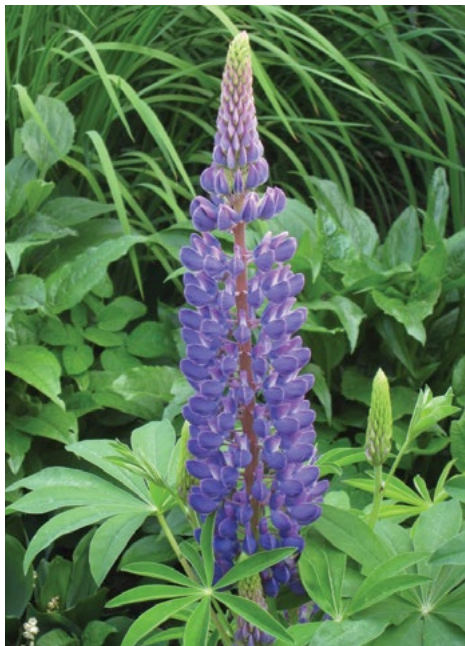
Mnogolistni volčji bob ( Lupinus polyphyllus )