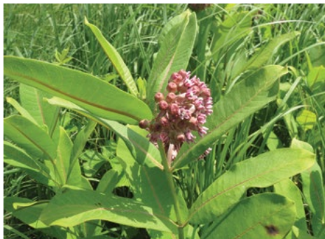
Sirska svilnica ( Asclepias syriaca )