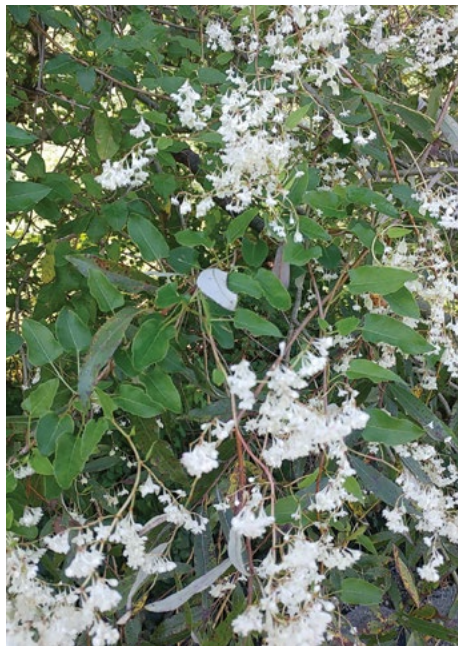
Grmasti slakovec ( Fallopia baldschuanica )