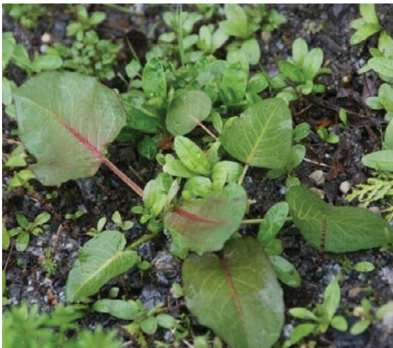
Mlade rastline japosnega dresnika so podobne nekaterim našim rastlinam, kot sta npr. navadni slakovec ( Fallopia convolvulus ) (levo) in topolistno ščavje ( Rumex obtusifolius ) (desno).