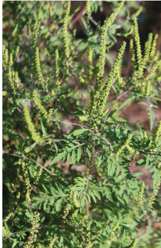
Odrasla rastlina v fazi cvetenja.

Zaradi izjemno velike alergeničnosti ima znaten vpliv na zdravje ljudi.