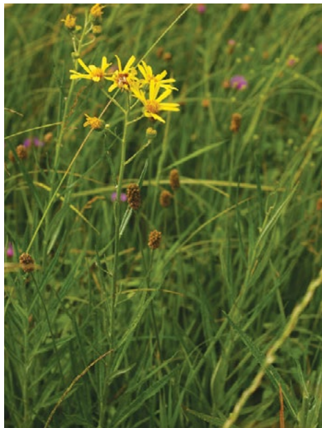
Podobni vrsti: šentjakobov grint ( Senecio jacobea ) in močvirski grint ( Senecio paludosus ).