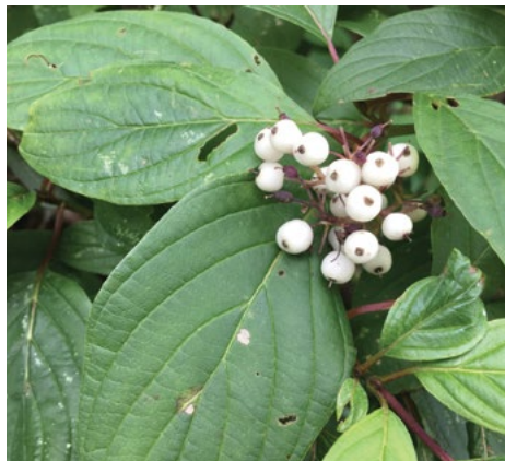
Sivi dren ( Cornus sericea )