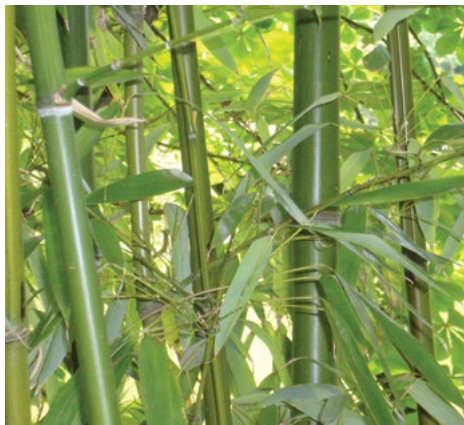
Bambus ( Phyllostachys spp.)