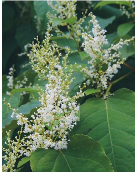
Socvetja in listi japonskega dresnika.

Kasneje se je največ širil s premiki zemljine ob gradbenih delih ter z vodotoki.