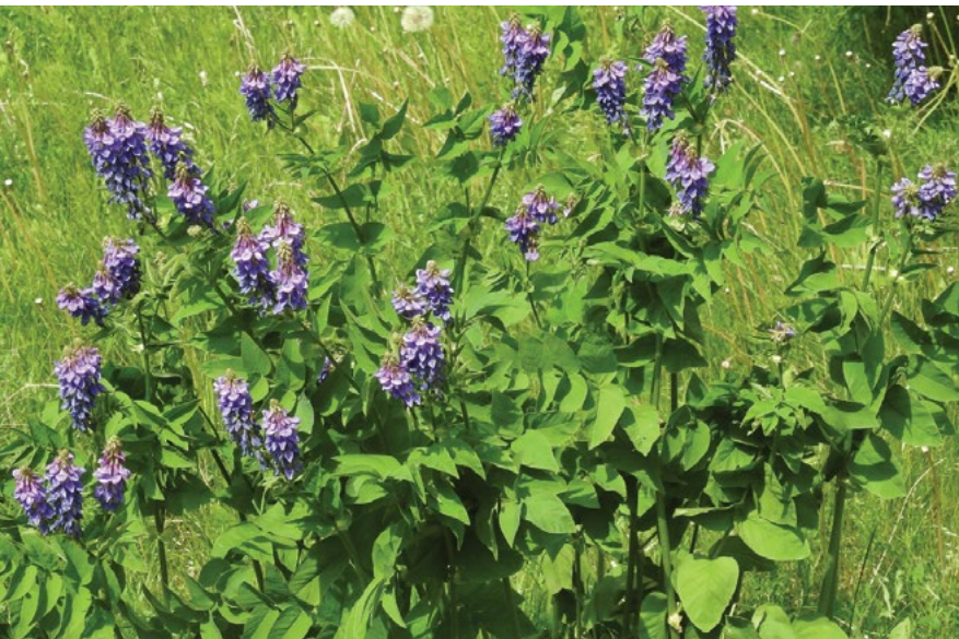
Modro cvetoče rastline vzhodne jastrebine.

Danes podivjana ali že invazivna ponekod v Rusiji, Estoniji, Latviji in skandinavskih državah.