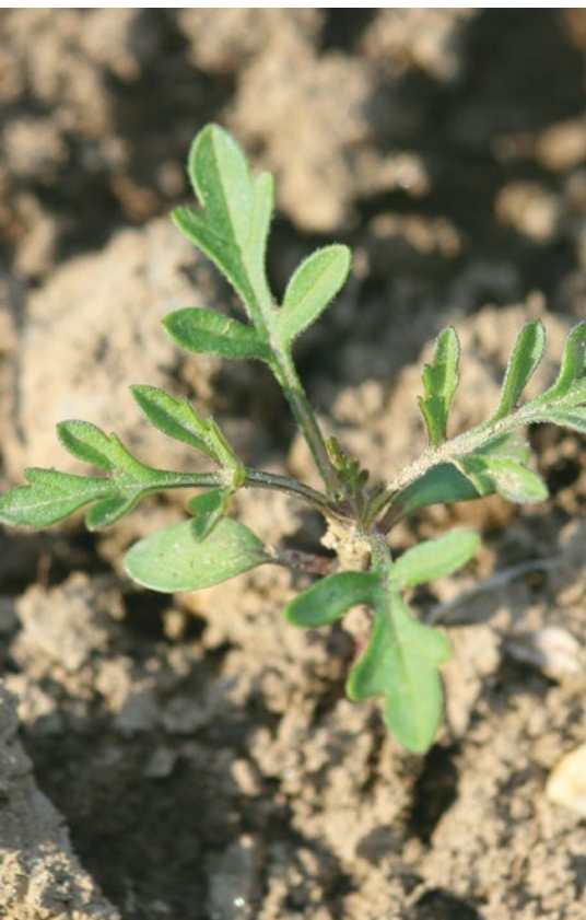
Mlada rastlina ambrozije.