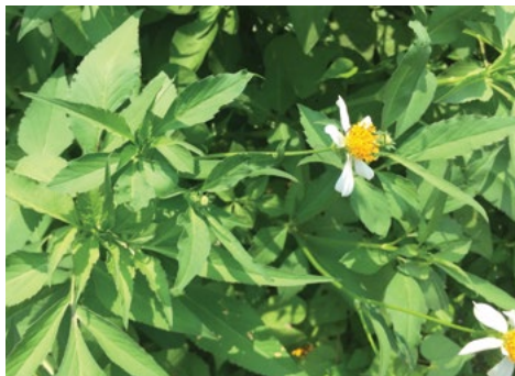
Dlakavi mrkač ( Bidens pilosa )