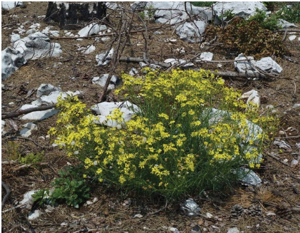
Zaenkrat je najpogostejši na suhih rastiščih na Primorskem; slika iz požarišča na Krasu.

Večinoma ne tvori enovrstnih sestojev, zato je vpliv na zmanjševanje biotske pestrosti manj izrazit, čeprav najbrž ne zanemarljiv.