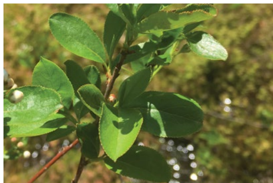
Vijoličnoplodna aronija ( Aronia prunifolia ) z zreliimi plodovi (levo) in črnoplodna aronija ( Aronia melanocarpa ) v cvetu (desno) (Foto levo: Michael Jeltsch, desno: Ron Sutherland).