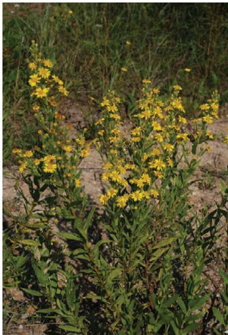
Podobni domorodni vrsti v času cvetenja: (levo) navadna zlata rozga ( Solidago virgaurea ) in (desno) lepljiva ditrihovka ( Dittrichia viscosa ).