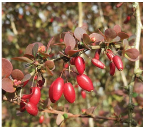
Thunbergov šipek ( Berberis thunbergii )