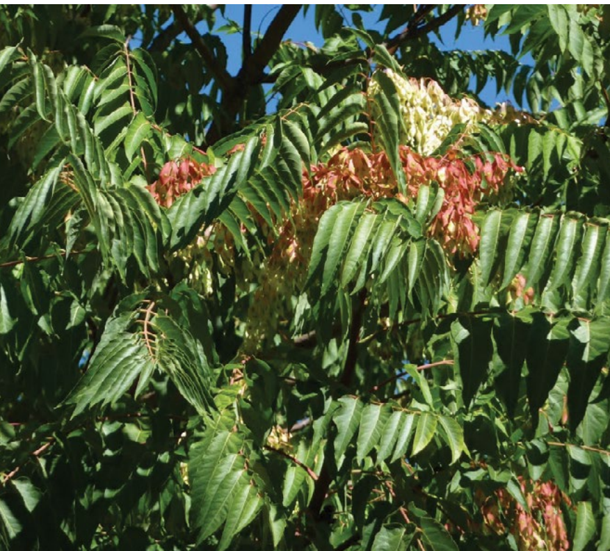
Ženska rastlina navadnega pajesena z zorečimi plodovi.

Cveti pozno spomladi, plodovi dozoriijo jeseni.