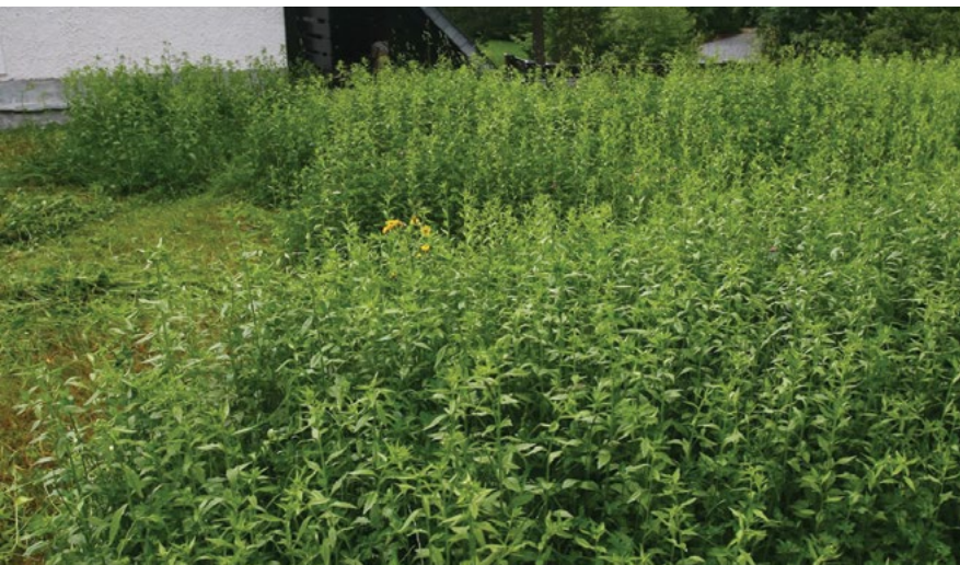
Masovno pojavljanje enoletne suholetnice iz navožene infestirane zemljine.