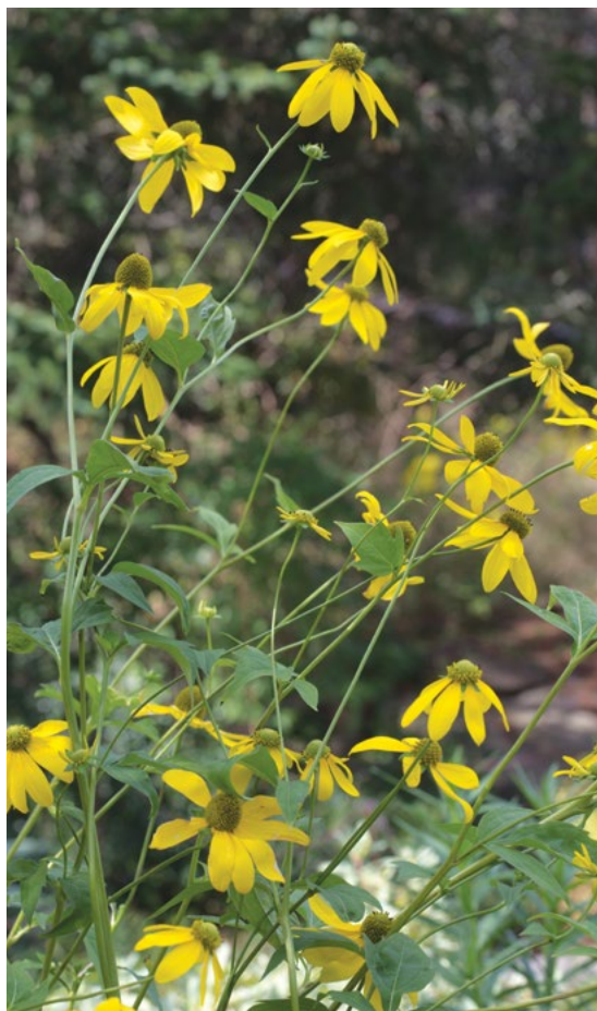
Cvetoči zgornji del stebela deljenolistne rudbekije.

Pri nas pogostejša v nižinskih območjih bližje naseljem.