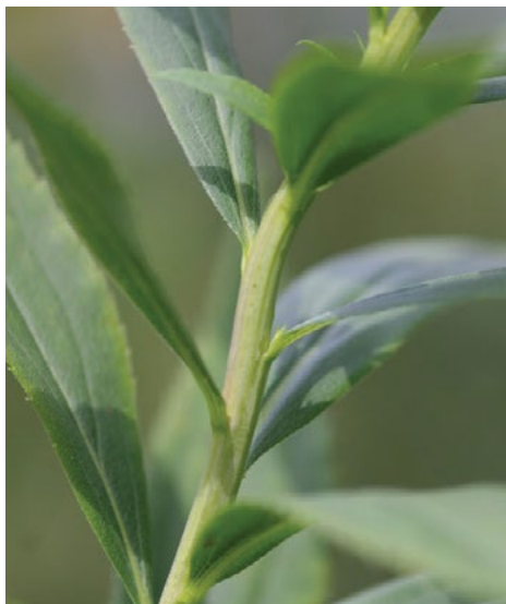
Steblo kanadske zlato rozge (levo) je dlakavo, steblo orjaške zlato rozge (desno) pa golo.