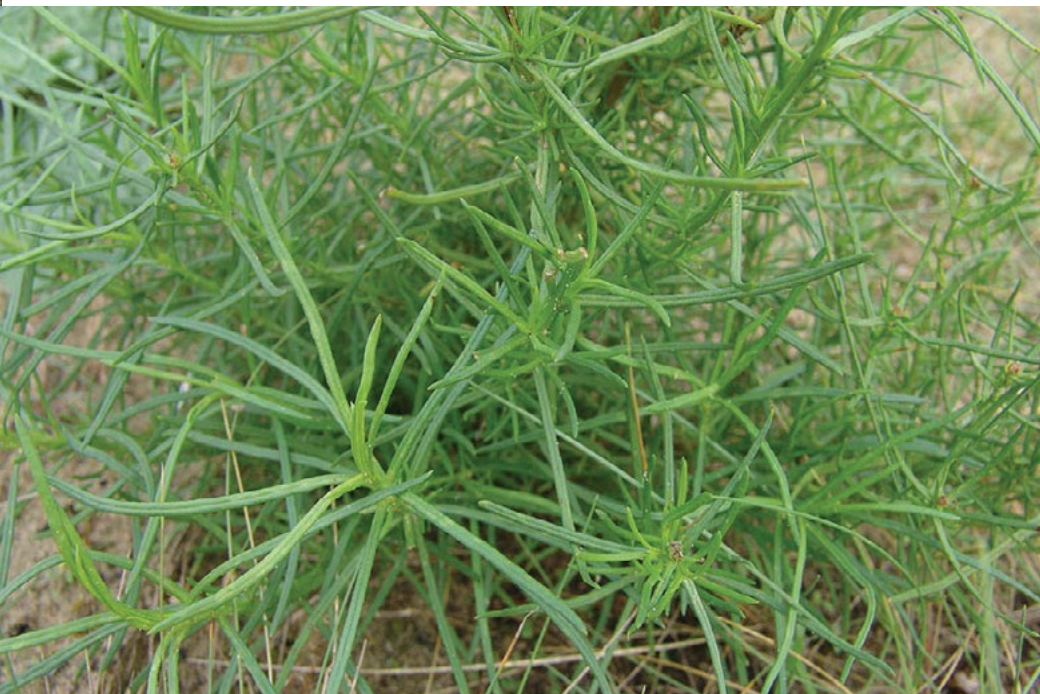
Rastlina raznozobega grinta pred cvetenjem.

Necvetoče nadzemne dele lahko kompostiramo ali pustimo na mestu, da zgnijejo. Cvetoče rastline je najbolje sežgati.