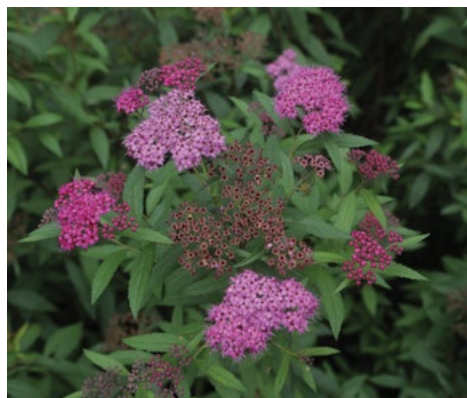
Japonska medvevka ( Spiraea japonica )