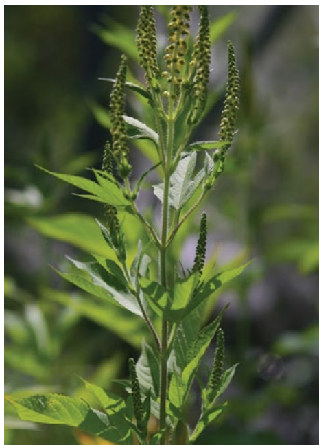
Trikpa ambrozija ( Ambrosia trifida )