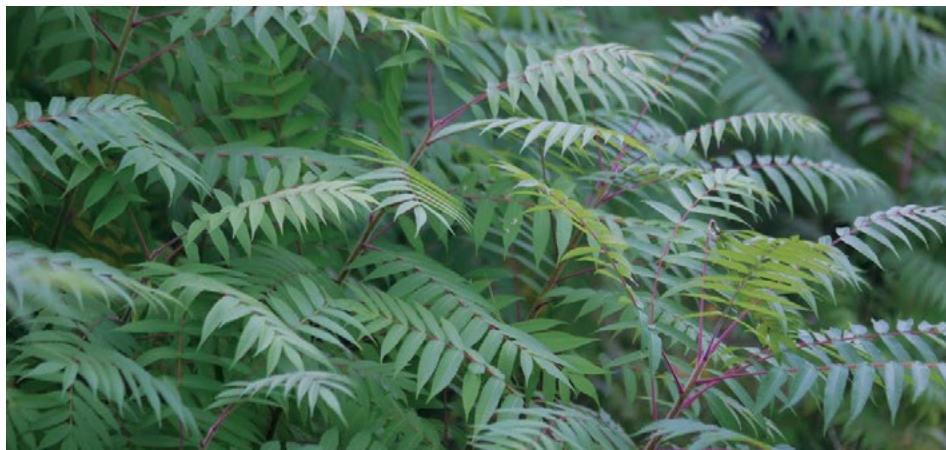
Mlade rastline octovca ( Rhus typhina ) so od daleč podobnega izgleda kot rastline velikega pajesena, od blizu pa opazimo gosto dlakavost listov, ki so brez vonja. Listi octovca jeseni rdečijo.

Podobne liste imajo tudi nekatere ameriške vrste orehov ( Juglans nigra , Carya spp.), ki tvorijo velike plodove (orehe), ter krilati oreškar ( Pseudocarya spp.), pri katerem so plodovi v navzdol visečih grozdih. Pri jesenih ( Fraxinus spp.) ali domačem orehu ( Juglans regia ) so listi iz precej manjšega števila lističev.