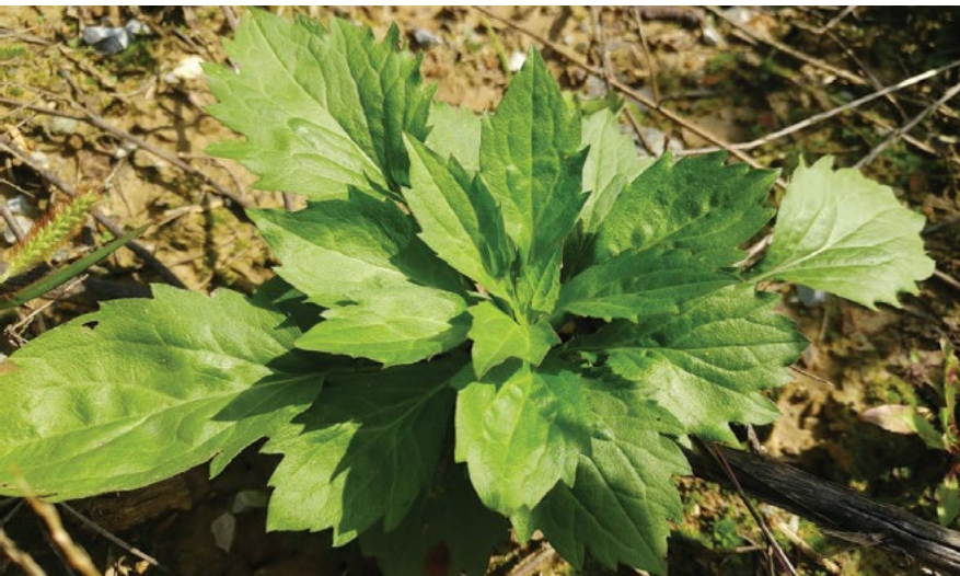
Pritlična listna rozeta pred odganjanjem stebela.

Z nekoliko manjšo zastopanostjo vendar vse bolj stalno je zastopana tudi na redno vzdrževanih kmetijskih površinah (njivah, travnikih in pašnikih); od travinja ji bolj ustreza polintenzivno polsuho do zmerno vlažno travinje.