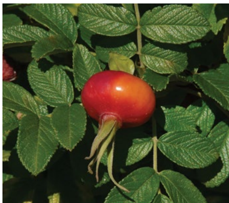
Japonski šipek ( Rosa rugosa )

Za poljedelstvo najbolj pomembno bo spremljanje novih njivskih plevelov, kot so nekatere zelo visokorasle in agresivne vrste ščirov ( Amaranthus rudis , A. palmeri , A. viridis ) in nekaterih trav ( Panicum dichotomiflorum , Panicum ruderale , Paspalum dilatatum , Setaria faberii ). Nadalje bodo najbrž tudi pri nas pomembni pleveli še: dlakavi mrkač ( Bidens pilosa ), virginijska akalifa ( Acalypha virginica ), oljčičevolistni razhudnik ( Solanum eleagnifolium ) ter zgoraj omenjene nove vrste ambrozij.