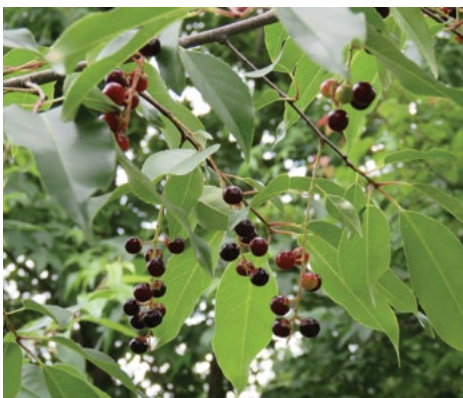
Pozna čremsa ( Prunus serotinus )