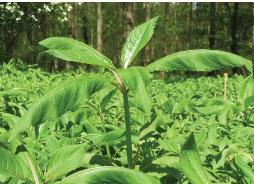
Rastline žlezave nedotike pred cvetenjem.