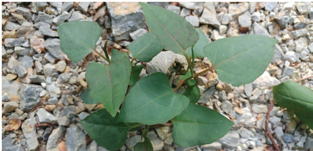
MLADE RASTLINE JAPONSEGA DRESNIKA, KI ODGANJAJO IZ KOŠČKOV KORENIK, PRENESENIH OB GRADBENIH DELIH.

V Sloveniji je razširjen povsod do nadmorske višine cca. 1000 m, manjka na bolj sušnih, kraških območjih.