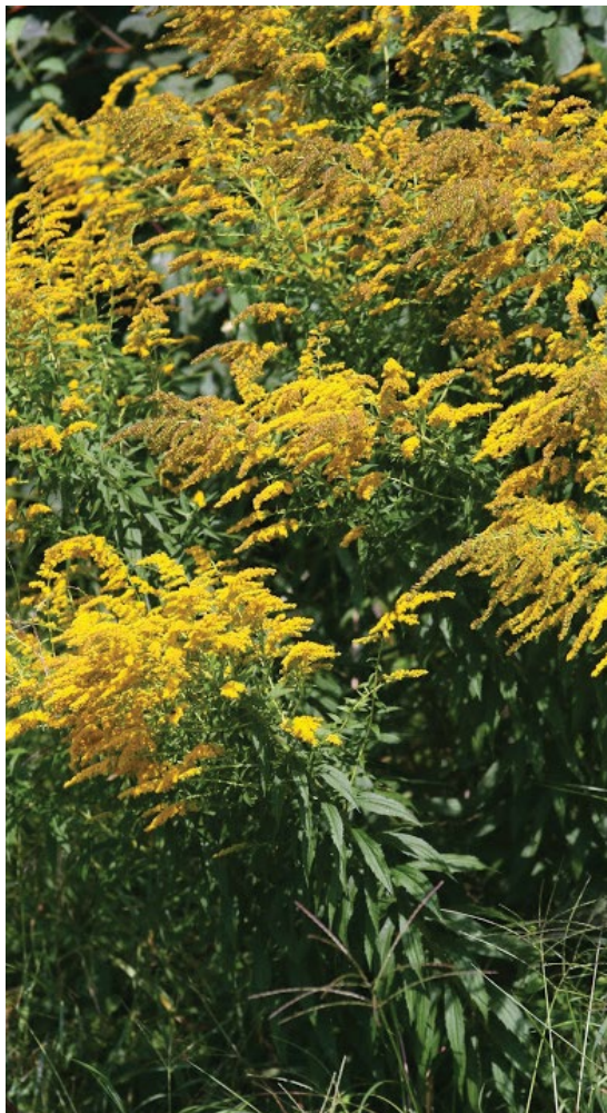
Cvetoče rastline orjaške zlate rozge.

V gostih sestojih je tudi do 300 stebel na kvadratni meter.