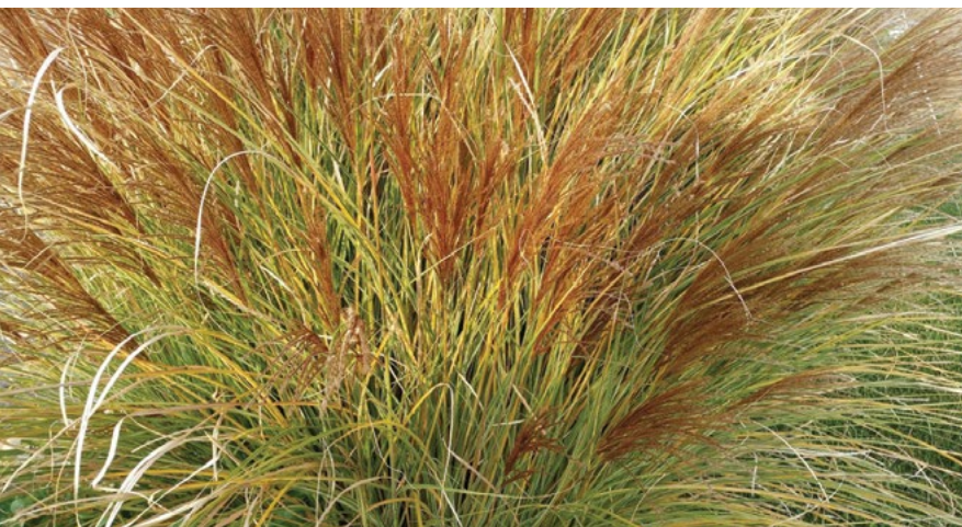
Kitajski miskant je okrasna trava, ki tvori goste šope.

Kitajski miskant se zaenkrat kot precej bolj invaziven kaže v ZDA.