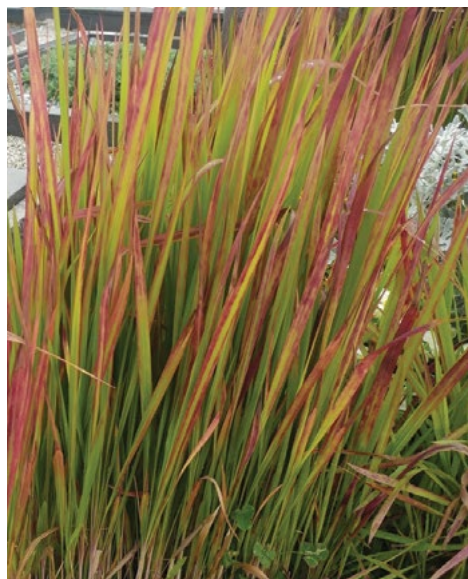
Navadna srebrolaska ( Imperata cylindrica )